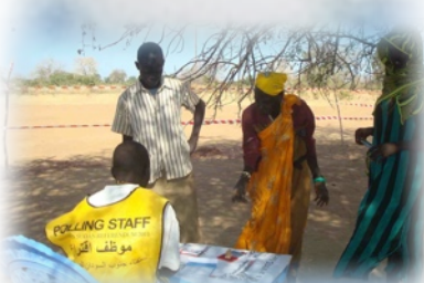
Wahl „lokal“ unterm Baum