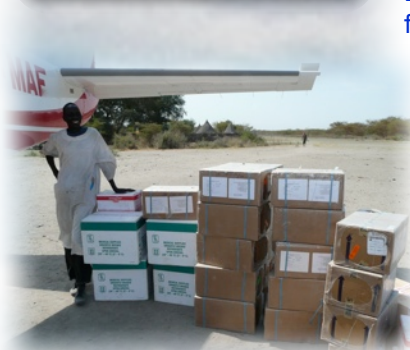
Nachschub für die Busch-Klinik!

Viszerale Leishmaniose (auch Dum-Dum-Fieber, Schwarzes Fieber oder Kala-Azar) ist weltweit nach Malaria die tödlichste parasitäre Infektionserkrankung, übertragen durch die Sandmücke. Anzeichen sind Müdigkeit, hohes Fieber, starker Gewichtsverlust, vergrößerte Milz und Leber, Gelenkschmerzen. Unbehandelt verlaufen über 90% der Infektionen tödlich, behandelt liegt die Sterberate immer noch bei bis zu 15%.