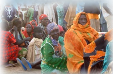
geduldiges, friedliches Warten